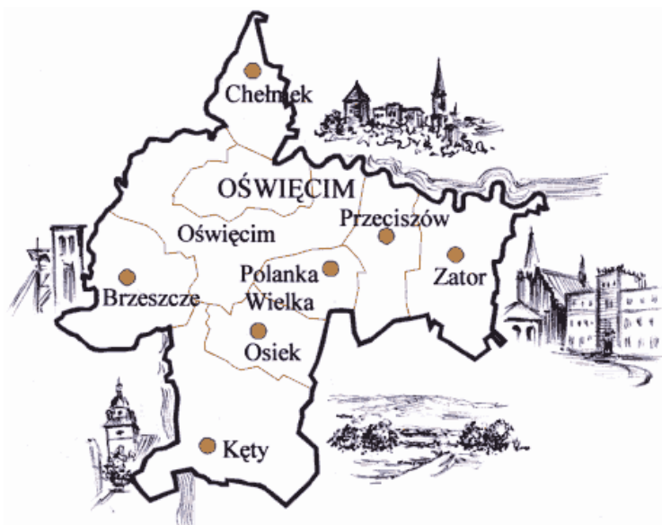
Rys.1. Usytuowanie gminy Chełmek w powiecie oświęcimskim.

Gmina Chełmek położona jest w zachodniej części województwa małopolskiego, w powiecie oświęcimskim, pomiędzy Oświęcimiem a Libiążem, u zbiegu rzek Wisły i Przemszy, na ich lewym brzegu. Gminę tworzą miasto Chełmek oraz dwa sołectwa Bobrek i Gorzów. Chełmek jest jedną z najmniejszych gmin powiatu oświęcimskiego, jej obszar wynosi 2.724 ha, z czego Bobrek i Gorzów łącznie zajmują 1.893 ha.